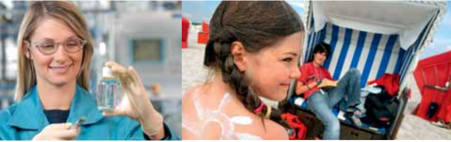
Auch bei der Herstellung von Lacken und Sonnencremes im Einsatz: die Nanotechnologie.

Förderung des Technologiefeldes. Dies könnte dazu beitragen, dass sich in vielen Teilbereichen deutsche Unternehmen durchsetzen werden.