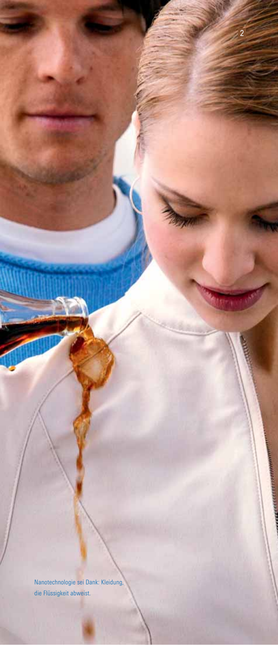
Nanotechnologie sei Dank: Kleidung, die Flüssigkeit abweist.